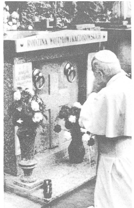
Links: Prozessionsbrauch. Rechts: Der Papst besucht das Grab seiner Eltern.

nisation eine Anziehungskraft auf Oppositionelle und Unzufriedene ausgeübt. Jetzt konnte die Solidarnosc diese Rolle übernehmen. Die Kirche steht mit ihrer pastoralen Arbeit als moralische Kraft im Dienste der Gläubigen; zur Lösung der ökonomischen und politischen Probleme und Gegensätze innerhalb der Gesellschaft ist sie nicht berufen.»