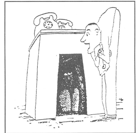
«Du kannst wieder herauskommen, die Perestrojka ist vorbei.» («Prawda», Moskau, 12.9.1988)

Solche Fragen beschäftigen nicht allein uns. Sie werden auch in der Sowjetunion selbst gestellt, sowohl in privaten Gesprächen (siehe unser Interview mit einem Sowjetbürger in der letzten Nummer) als auch in aller Öffentlichkeit. Ein Beleg dafür ist die hier reproduzierte «Prawda»-Karikatur über einen Bürokraten, der sich angesichts der Veränderungen provisorisch unter seinen Schreibtisch verkrochen hat. Er dürfe wieder hervorkommen; die Perestrojka sei vorüber.