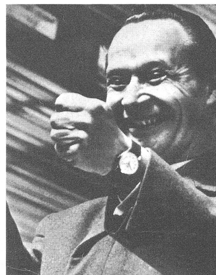
A. Dubcek in einer legendären Aufnahme.

In der ČSSR lief am Ende der Novotny-Ära eine Protestwelle der Intellektuellen gegen die Missstände im Land an. Im Juni 1967 kumulierte er in Prag beim Kongress der Schriftsteller, die sich endlich über die Probleme der Gesellschaft frei aussprechen wollten. Kurz zuvor hatte in der UdSSR Alexander Solschenizyn einen offenen Brief an den Moskauer Schriftstellerkongress geschrieben. Sein Schreiben prangerte die jahrzehntelange Unterdrückung der Literatur durch die Zensur an und mündete in den Satz: «Niemand kann der Wahrheit den Weg versperren.» In Moskau wurde er daran