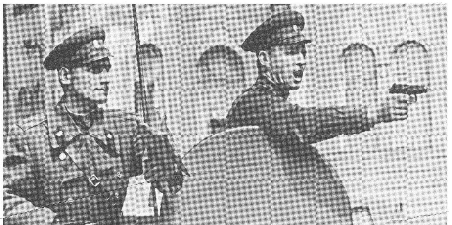
Den Leuten die Breschnew-Doktrin beibringen.

Selbstverständlich wollten die Prager Reformer (sogar abgesehen davon, dass sie keine Wahl hatten) einen «wirklichen» Sozialismus, und selbstverständlich wollte bei dieser Chance die