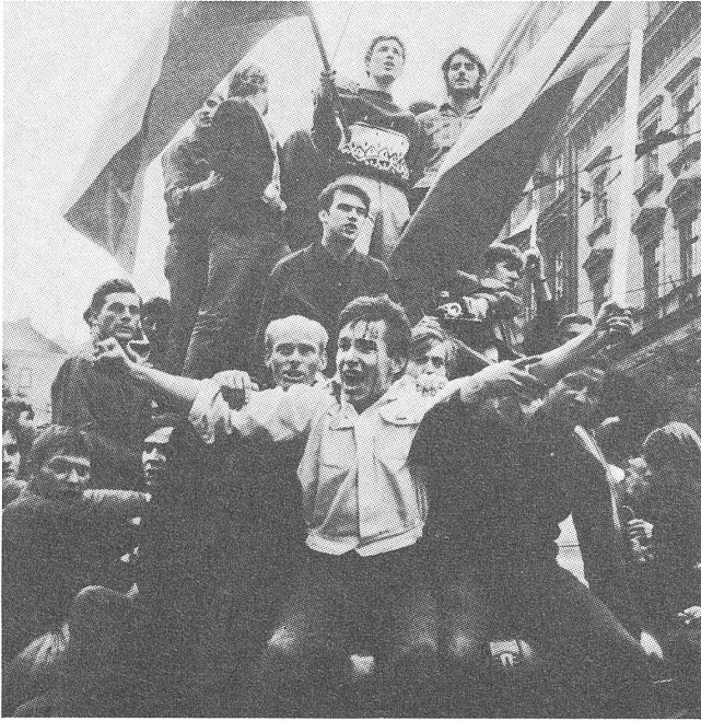
Nach dem 21. August 1968: In allen Städten zeigte die Bevölkerung aktiv, aber gewaltlos ihre Empörung.

gehindert, seine Botschaft vorzutragen, aber in Prag wurde sie unter Missachtung eines entsprechenden Parteiverbots vorgelesen: eines der Vorzeichen des kommenden Umbruchs.