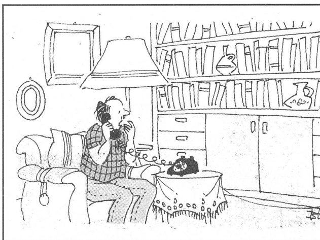
Überflüssig «Könntest Du mir in Erfahrung bringen, ob man im Westen vielleicht einen marxistischen Ideologen braucht?» («Ludas Matyi», 20. 7. 1988.)