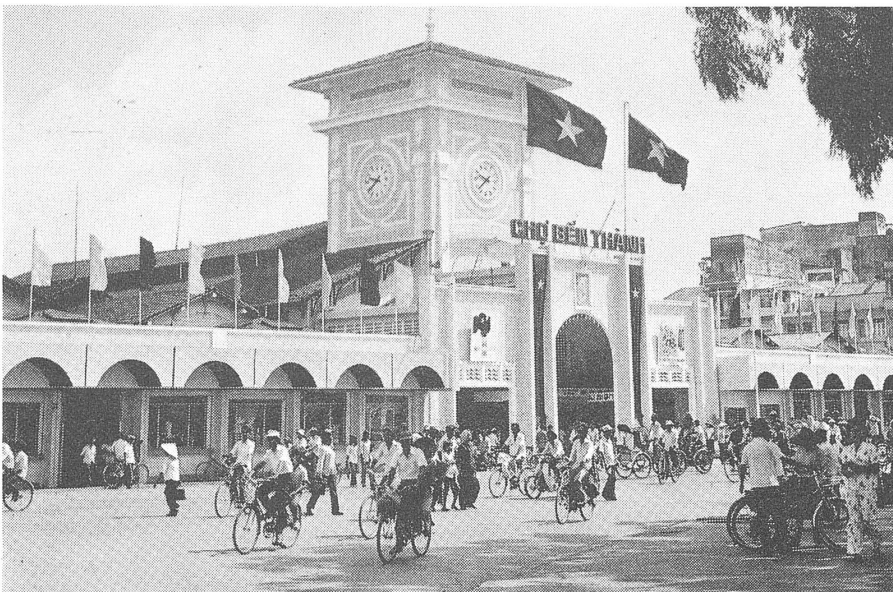
Markthalle Ben Thanh in Ho-Chi-Minh-Stadt.