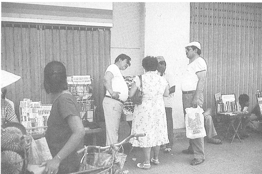
Sowjetische Touristen: vom Warenangebot überwältigt.