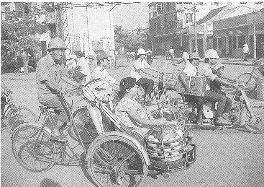
Velorikscha: das Taxi des Fernen Ostens, unterwegs mit einer Kundin.

Vor 13 Jahren hat der Einzug nordvietnamesischer Panzer in Saigon den Krieg beendet. Das Versprechen von «Unabhängigkeit, Freiheit und Glück» hat auch der Friede für die Bewohner von Ho-Chi-Minh-Stadt nicht erfüllt. ■