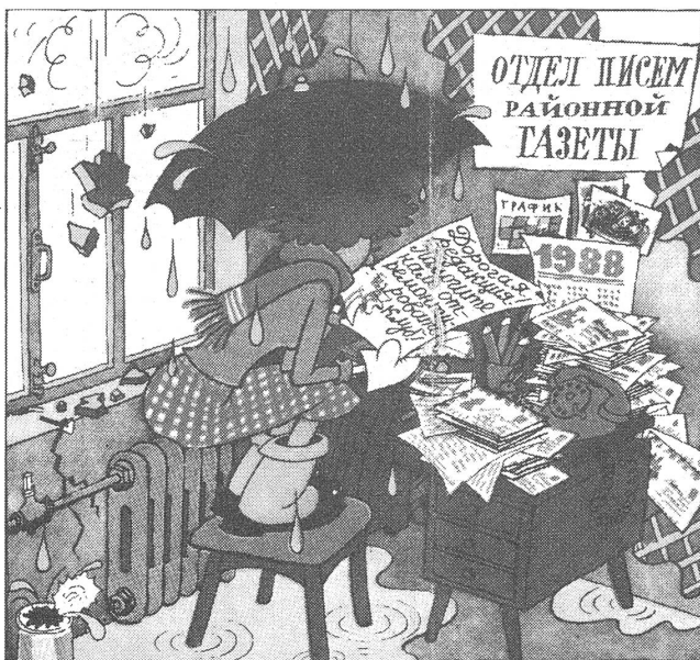
Leserzuschrift an die Redaktion einer Provinzzeitung: «Liebe Redaktion, helfen Sie uns doch bitte, unseren Clubraum zu renovieren!» («Krokodil», Moskau, 4. 1988)

Wieweit gibt es in der Sowjetunion heute Armut und soziale Ungerechtigkeit? Solche Dinge durfte es, ähnlich wie die Arbeitslosigkeit, nach bisheriger Lesart nur in der kapitalistischen Gesellschaft geben, die sie auch verursachte. Heute beginnt man, immer noch behutsam, einzuräumen, dass das auch in sozialistischen Verhältnissen ein Thema ist.