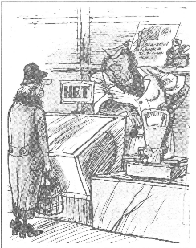
Aufschrift auf der Tafel: «Nicht vorhanden». Kundin: «Was ist nicht vorhanden?» Verkäufer: «All das, was Sie brauchen!» («Krokodil», Moskau, 12. 1988)

sich so aus, dass die Statistik die sozialen Zustände besser darstellt, als sie sind. Anders aber sieht die Sache aus, wenn man an die statistische Nichtberücksichtigung von halblegalen bis illegalen Zusatzeinkommen denkt, die niemand deklariert.