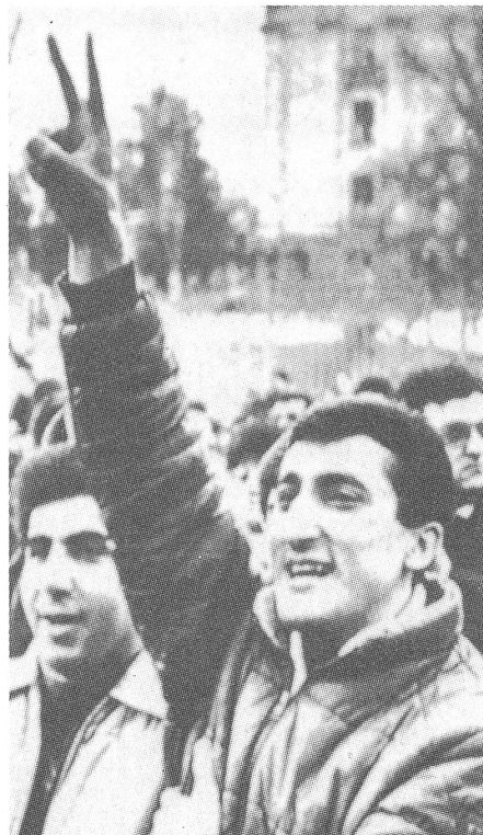
Armenische Zuversicht, etwas verfrüht.

Gorbatschow hat die Perestrojka mehrmals eine «Revolution» genannt; damit könnte er anders recht haben als er meinte. ■