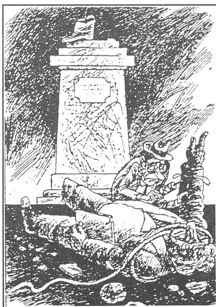
Wiederbelebungsversuch an einem gestürzten Denkmal.