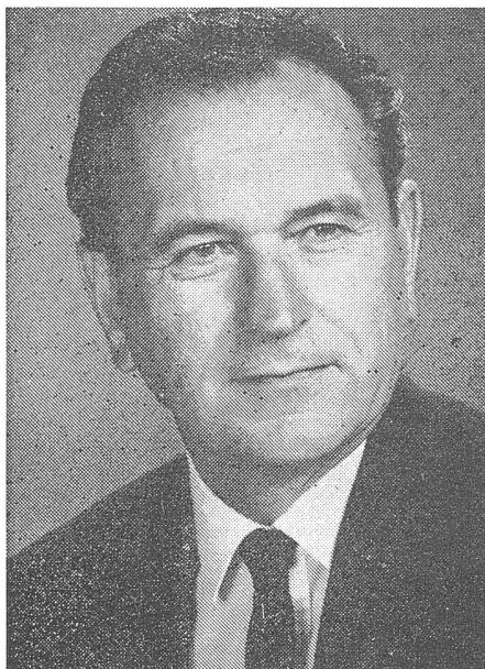
Parteichef Karoly Grosz.