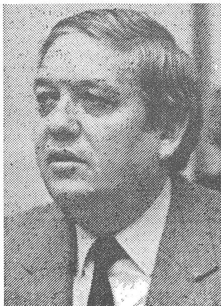
Volksfrontpräsident Imre Pozsgay.