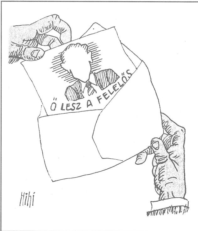
Der Neue. «Er wird verantwortlich sein», steht beim Porträt, und die Bildlegende ergänzt «... für die in den achtziger Jahren begangenen Fehler.»

des Volkes und der Nation zu bezeichnen; angesichts der «Entsetzlichkeiten der jüngsten Vergangenheit und der Gegenwart» gehe das nicht an.