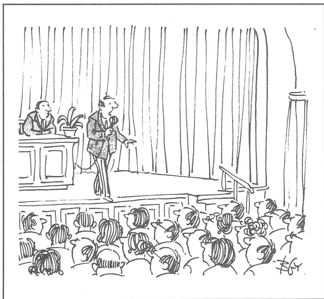
Liberale Zeiten: «Wir werden darüber abstimmen, Genossen, ob wir die (Internationale) singen wollen oder nicht.»

Punkt 1c verpflichtet die Parteimitglieder, öffentlich immer den Standpunkt der Partei zu vertreten (was der althergebrachten Regelung entspricht); sie dürfen sich nicht ablehnend über Parteibeschlüsse äussern. Allerdings darf die Minderheit ihren abweichenden Standpunkt gegebenenfalls zur erneuten Prüfung unterbreiten, was eine Absage an die frühere Lesart darstellt.