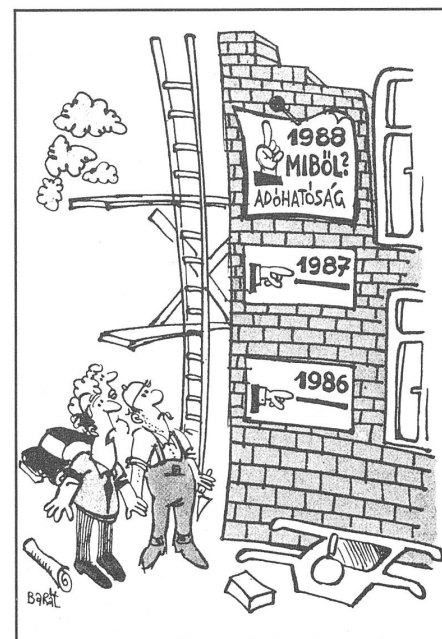
Bau des neuen Steueramtes.

In Punkt 2 wird eine neue Arbeitsteilung zwischen Partei und Regierung verlangt. «Die Einflussnahme der Partei auf das staatliche Leben muss in ihren Prinzipien und Methoden modernisiert werden.» In diesem Kontext kommt es zur Forderung nach einem neuen Wahlgesetz, damit unterschiedliche Organisationen und Interessengruppierungen bei der Aufstellung von Kandidaten mitreden dürfen. Ferner will man die Referendumsmöglichkeit einführen: «Über Volksabstimmungen auf nationaler und lokaler Ebene soll ein Gesetz verabschiedet werden.»