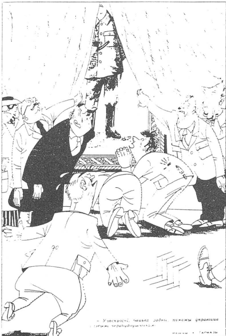
Versammlung vor dem halb verhüllten Stalinbild: «Auferstehe, Vater, und hilf uns, mit diesen Perestrojka-Typen aufzuräumen.» («Woschik», Minsk, Nr. 3/1988)

Die einfachen Menschen kennen sich da besser aus, weil sie alles selber durchlitten und ausgehalten haben. Die Geschichte des Volkes ist etwas anderes, als das, was uns «die Kader» immer noch wie früher einzureden suchen. Die Kader, die wohl kaum fähig oder willens sind, sich umzustellen. W. Losew, Dnjepropetrowsk