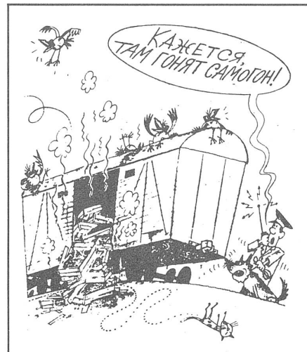
Eine Karikatur von «Krokodil» (Moskau, Nr. 8/1988) zu einer Traubenlieferung an die Militärhandelsgesellschaft von Liepaya (Lettland). Elf Tonnen waren von ungenügender Qualität, und der Rest verfaulte. Meldung des Wachtammes: «Ich glaube, die machen Samogon (Schwarzbrand).»