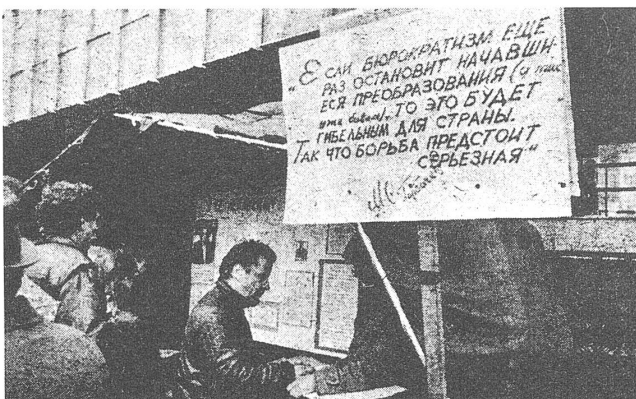
Unterschriftensammlung für Leute, die als Delegierte für die Parteikonferenz kandidieren, in Irkutsk.

In Reformsachen ist die Volksrepublik China der Sowjetunion zehn Jahre voraus. Die chinesische Volkswirtschaft erlebt einen nie dagewesenen Aufschwung. Seit 1983 stieg das Brutto-sozialprodukt um durchschnittlich 10%. Das rasante Wirtschaftswachstum brachte aber den Chinesen auch Probleme. China erlebt eine Konjunkturüberhitzung. Die Folgen sind unter anderem eine offizielle Inflation von 7%, sinkender Lebensstandard für Teile der Bevölkerung und gar Rationierung von Lebensmitteln. Der Grund dieser Entwicklung ist die zu schnell wachsende Wirtschaft, das heisst, einzelne Sektoren und Branchen können nicht mithalten, und es kommt zu Engpässen. Die chinesische Regierung steckt in einer eigentlichen Zwangslage. Sie möchte noch mehr freie