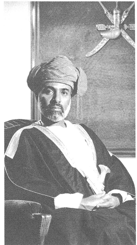
Sultan Kabus von Oman.

Ein nicht ganz typischer Fall im Golftrat ist das Sultanat Oman. Obwohl es eine Enklave an der Meerenge von Hormuz hat, einen strategisch wichtigen Punkt hiermit, liegt sein eigentliches Staatsgebiet mit weit über 1000 km Küste ganz am Indischen Ozean. Dort (in der südlichen Provinz Dhofar) liegt auch sein Erdölhafen, so dass es auf die Golfschiffahrt selber nicht angewiesen ist. In seiner Geschichte war das Land stärker auf den indischen Subkontinent ausgerichtet als auf die Wüstengebiete «im Rücken».