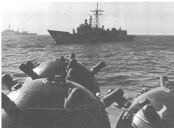
Iranische Minen gegen die Seefahrtswege am Golf.

Indessen ist Oman entschlossen, sich nicht in den Golfkrieg hineinziehen zu lassen, bis auf