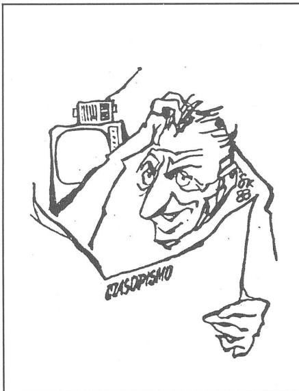
«Schon seit langem habe ich vermutet, dass die Rettung für die Prinzipien darin besteht, sich von ihnen zu lösen.» («Polityka», Warschau, 2. 4. 1988)

Daran ändert nichts, dass sich der ehemalige Moczar-Flügel der Partei heute, im Schulterchluss mit den sowjetischen Perestrojkagegnern, in Opposition zum jetzigen Führungskurs befindet, dem die «Partisanen» von damals seinen «Reformismus» vorwerfen. Zu ihnen gehören der frühere Innenminister Franciszek Szlachcic und der frühere polnische Botschafter in Moskau, Stanislaw Kociolek, die in einer