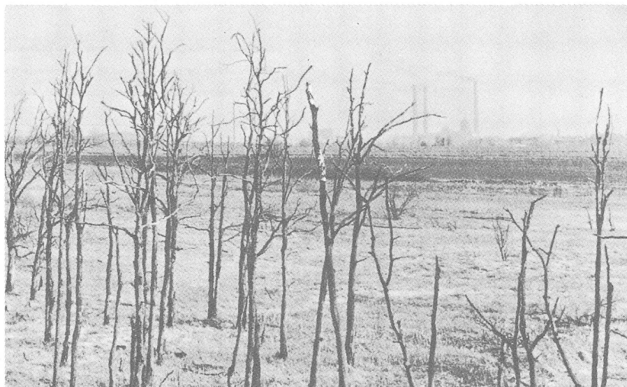
Verkanntes Haupttraktandum Umweltzerstörung. Toter Wald in Schlesien. («Der Spiegel», Hamburg)

Unter diesen Umständen war es nicht verwunderlich, dass zum Gedenken an den Ghetto-