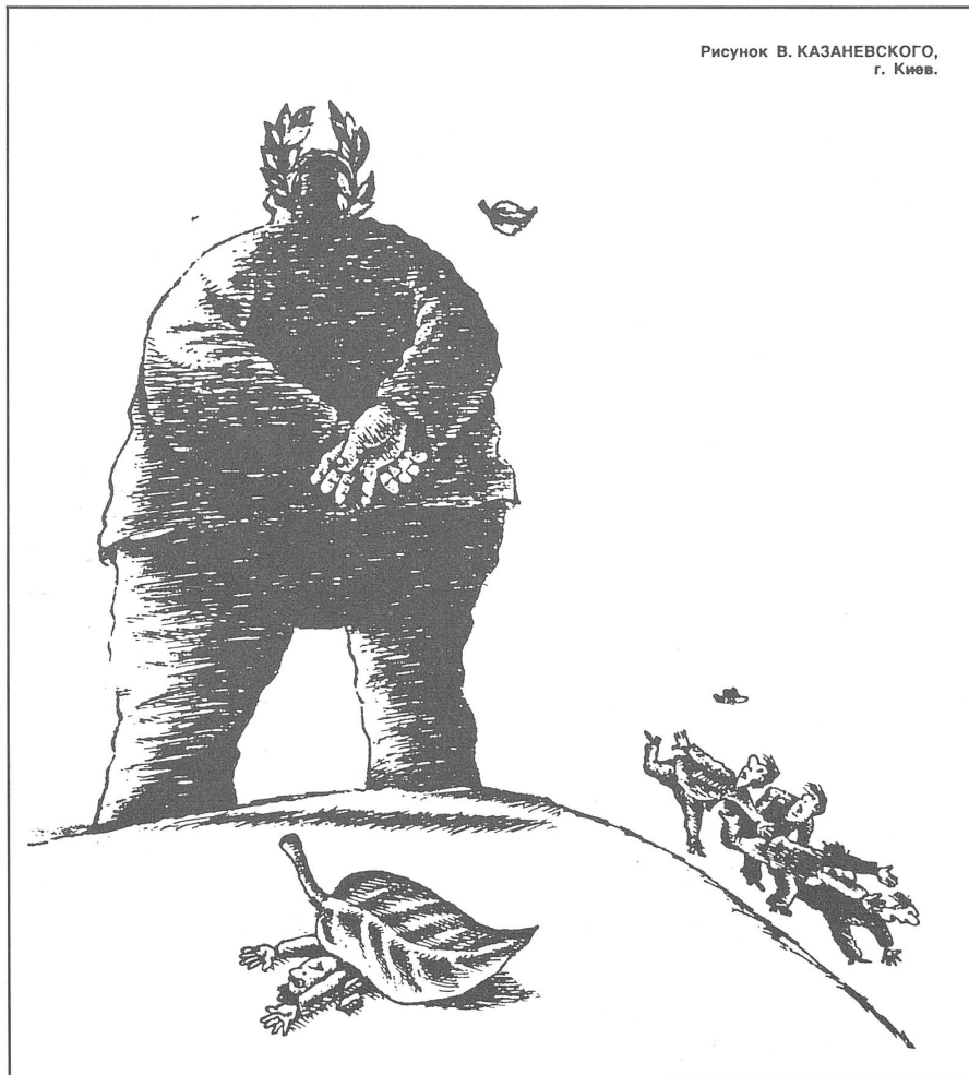
Рисунок В. КАЗАНЕВСКОГО, г. Киев.

Die Reformbefürworter werben in der gegenwärtigen Kampagne auch dafür, dass die im Verlauf der bevorstehenden Plenarsitzung des Zentralkomitees gemachten Vorschläge ebenso wie die Ansichten der führenden Politiker veröffentlicht werden. Die Konservativen müssten Flagge zeigen und ihre Karten auf den Tisch legen. Gorbatschow selbst betont immer wieder, die Reformpolitik bedeute «keine Abkehr vom Sozialismus». Das sagte er auch in Jugoslawien während seines Staatsbesuchs im März und bekam von einem jugoslawischen Arbeiter zu hören: «Sozialismus ist nicht die Lösung, sondern das Problem...» Jacques Baumgartner