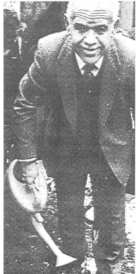
Ministerpräsident Yitzhak Shamir.