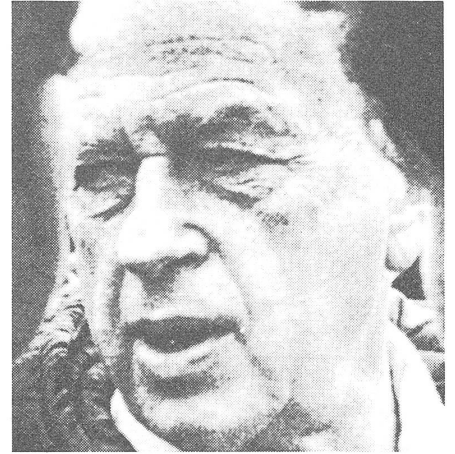
Verteidigungsminister Yitzhak Rabin.

wählter Autonomierat der Palästinenser bestimmt danach seine Vertreter für Verhandlungen mit den Israeli.