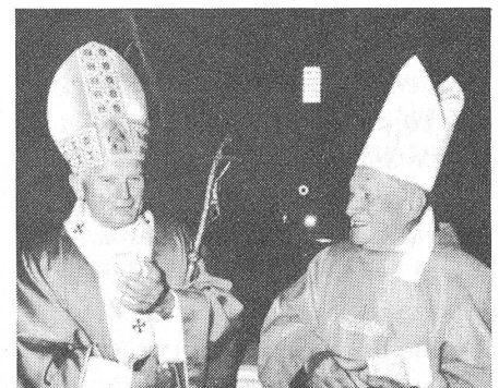
Kardinal Tomásek mit dem Papst bei der Zelebrierung einer Messe am 11. 10. 1987.