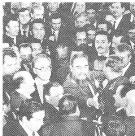
Castro beim KPdSU-Kongress vor zwei Jahren.