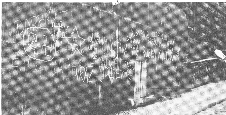
Die Parallele der Besatzungsmacht. Sichel und Hammer gleich Hakenkreuz, das Hakenkreuz im Sowjetstern: solche Zeichen malten die Tschechoslowaken an die Strassenwände, als sie 1968 von der Sowjetunion überfallen wurden.

Erleichtert wurde das durch die Tatsache, dass die Tschechen und Slowaken das Verhalten Frankreichs und Grossbritanniens von 1938 noch in Erinnerung hatten, wogegen ihnen von der UdSSR nichts Nachteliges bekannt oder präsent war. Es gab ein schlagseitiges Misstrauen, das auch die Politik von Benesch prägte. Er baute nach dem Freundschafts- und Beistandspakt mit der UdSSR 1943 auf die Loyalität Stalins und erhoffte sich von ihr eine Garantie für die Unabhängigkeit des Landes. Demgegenüber vergass er den demokratischen Mächten Frankreich und Grossbritannien ihren Verrat von München nicht und wollte we-