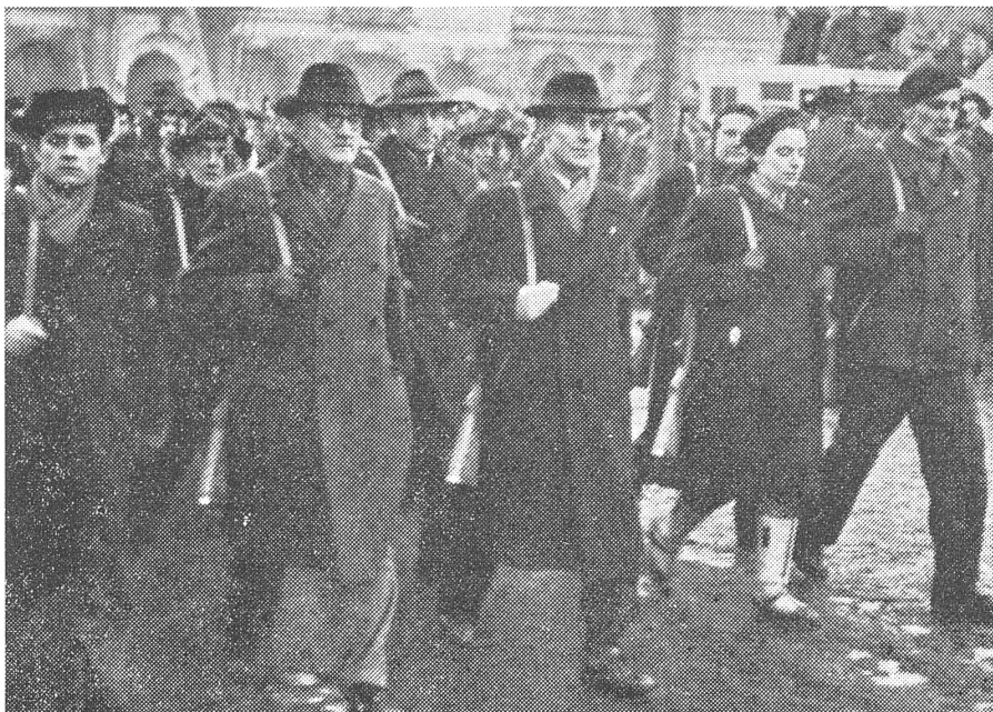
Die bewaffneten «Arbeitermilizen» der KP marschierten im Februar 1948 in den Strassen von Prag auf.

Dazu geführt hatte die westliche Appeasement-Politik, um deren Wiedergutmachung sich die Alliierten im Zweiten Weltkrieg bemühten. Auch die UdSSR hatte ein Interesse an einem freundlich gesinnten slawischen Nachbarn. In der Tschechoslowakei selbst drückte der Widerstand gegen die Naziokkupation (das Attentat auf den Reichsprotektor Heydrich mit dem