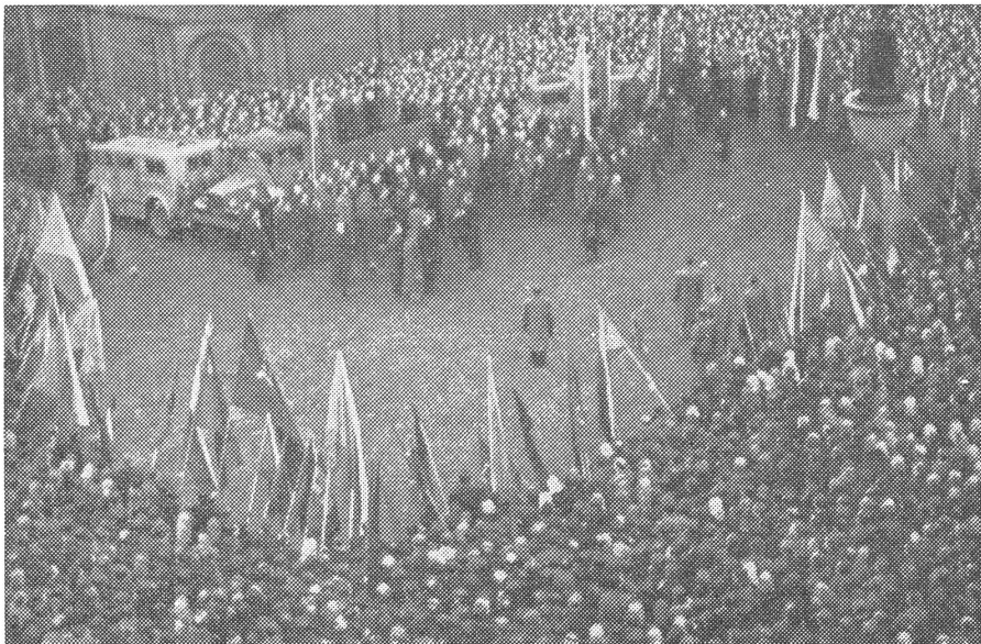
25. Februar 1948: Der KP-Chef Klement Gottwald, der sich anschickt, Präsident der Republik zu werden, trifft auf dem Wenzelsplatz ein.

Laut späteren Angaben des Obersten Gerichtshofes in Prag wurden zwischen 1948 und 1953 rund 83 000 Personen wegen politischer Verbrechen abgeurteilt (die Zahl der Verurteilungen wegen sogenannter Wirtschaftsdelikte ist hier nicht eingeschlossen). Von Oktober 1948 bis Januar 1953 wurden 178 Personen hingerichtet, die einige Jahre später als unschuldig rehabilitiert wurden. Das Regime aber, das die eingestandenen Justizmorde angeordnet hatte, überlebte, was kein demokratisches Regime tun könnte.