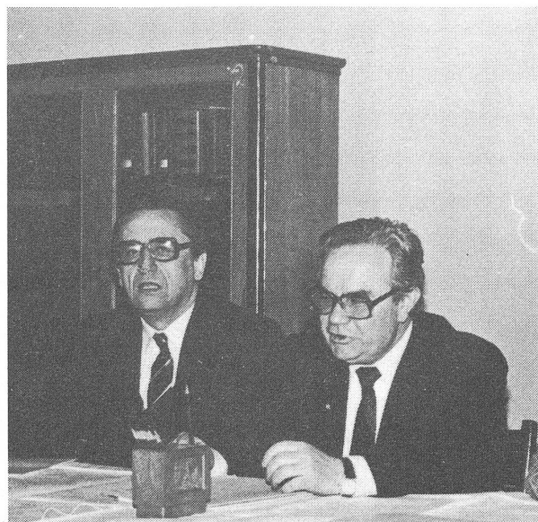
4 Beim Präsidenten des Rates für religiöse Angelegenheiten der UdSSR, Konstantin Chartschew.