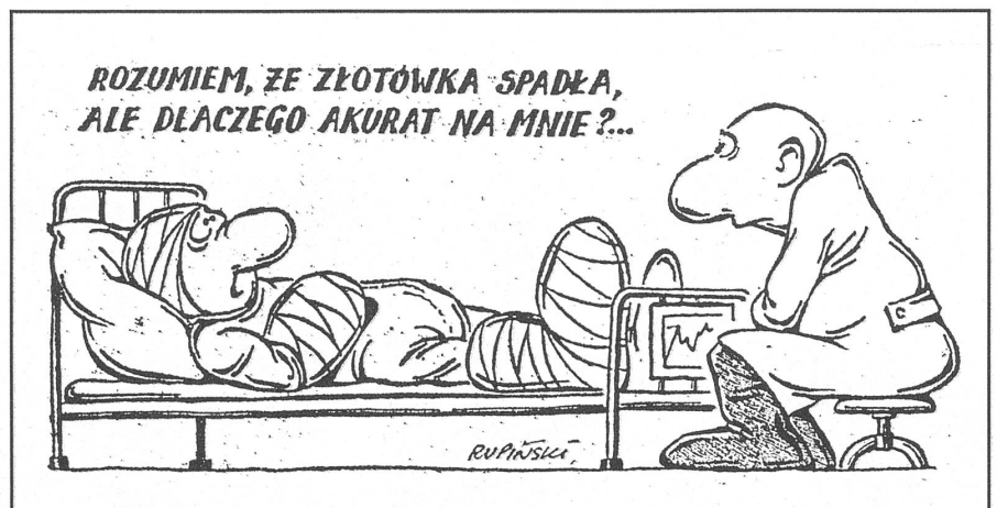
«Ich verstehe, dass der Zloty gefallen ist. Aber warum ausgerechnet auf mich?» («Trybuna Ludu», Warschau, 14. 1. 1987)

Das war bis vor kurzem auch im sozialistischen Polen der Fall. Unter Kardinal Stefan Wyszyński, dem verstorbenen Primas, füllte die Kirche