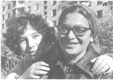
Ida Nudel kurz vor ihrer Ausreise am 16. Oktober 1987.

vermutet, die Ida Nudel während so langer Zeit bekundet hat.