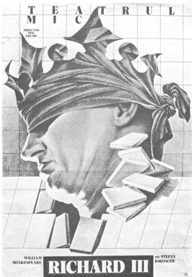
Ein Theaterplakat, das in Bukarest viel zu flüstern gab. Für die Kenner gilt es als ausgemacht, dass der König, dem die Krone den Blick verschattet, das Gesicht von Ceausescu hat. Nachweislich ist so etwas nicht, aber die Ähnlichkeit besteht.

Auch reguläre Arbeitsplätze werden den Leuten normalerweise obligatorisch zugeteilt, und diese Praxis wird manipulatorisch gegen nationale Minderheiten und Andersdenkende eingesetzt. Man schickt Leute ungarischer Abstammung in rein rumänische Gebiete, man desintegriert geistig unbotmässige Familien, und man entfremdet Seelsorger von ihrer Gemeinde. ►