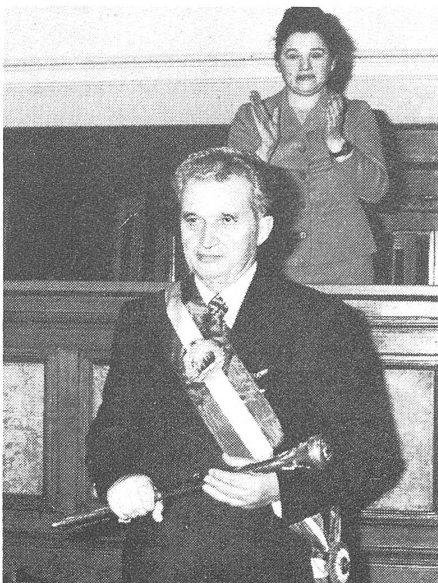
Monarchisch in Szene gesetzt: N. Ceausescu.

Am 26. Januar beging Nicolae Ceausescu seinen 70. Geburtstag. Seit mehr als zwanzig Jahren herrscht er über 23 Millionen Untertanen wie ein absoluter Monarch und lässt sich huldigen. «Die Sonne unseres Volkes. Das Genie, das dem menschlichen Denken neue Horizonte