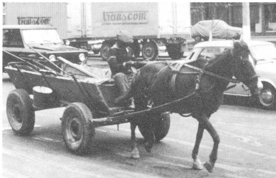
Was unfreiwillig noch gut ist: mehr Pferdegespanne in Bukarest.