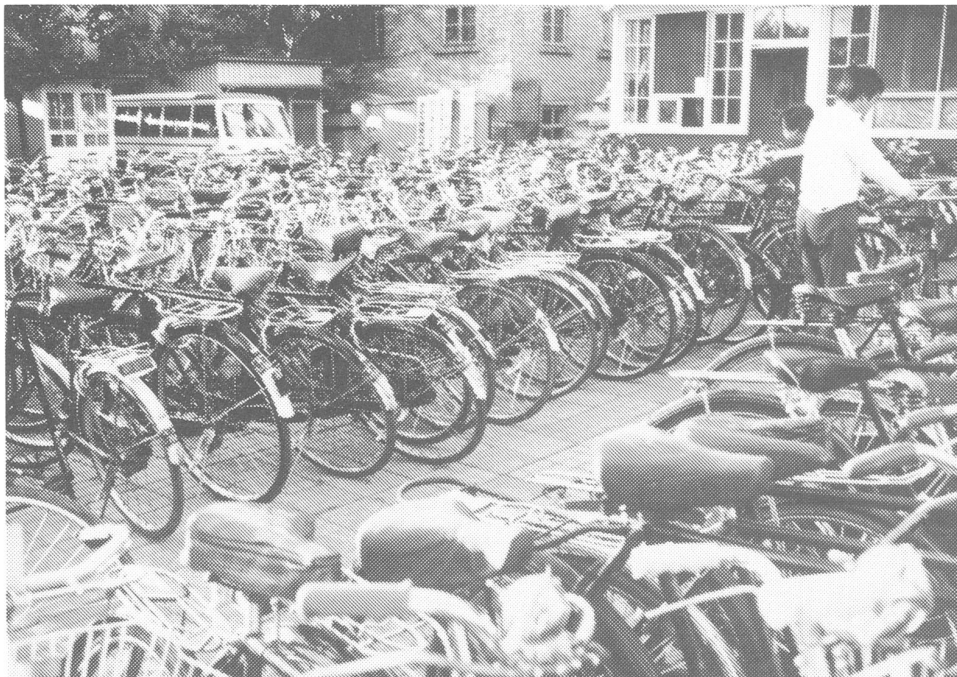
Hier bleibt China ein Vorbild für die Europäer: Das Fahrrad ist nach wie vor das wichtigste Verkehrsmittel. Velopark in Peking.

Im Interesse des Wirtschaftswachstums erwies sich die Einführung einer neuen Verteilungsstruktur als notwendig. Neben der Kombination von Stücklohn und Prämie wurde in einigen Betrieben ein System eingeführt, in wel-