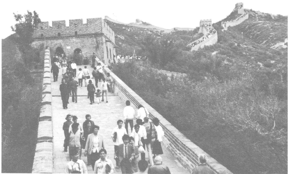
Oben: Freier Markt in Peking. Mitte: Die wichtigste «Zugmaschine» südlich von Schanghai bleibt der Wasserbüffel. Unten: Das neue Phänomen des Inlandtourismus merkt man am besten bei der Chinesischen Mauer.