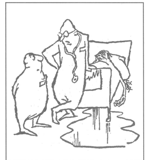
«Er ist jetzt schon so lange krank; da könnten wir vielleicht doch damit anfangen, ihn zu behandeln.» («Polityka», Warschau, 5. 12. 1987)

Ein mehrfach wiederholter Widerspruch nach jeweils gleichem Muster betrifft die Zeit. Etliche Male situiert Gorbatschow das Aufkommen autoritärer Führungsmethoden und vieler anderer Übel als Erscheinung der siebziger Jahre. Handkehrum aber beklagt er, dass man