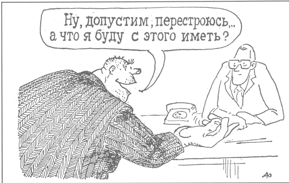
«Angenommen, ich würde mich umgestalten, was kriege ich dann dafür?»

chen Grund ihrer Notwendigkeit. Die Person, die im ersten Kapitel eine Krise der Sowjetgesellschaft diagnostizierte, konnte – so liess sich folgern – nicht gut die gleiche Person sein, die genau diese Diagnose im Vorwort explizit und apodiktisch als völlig verfehlt bezeichnete, als westliche Version überdies, die aus vielsagend offengelassenen Motiven entstanden wäre. Also brauchte es für die zwei gegensätzlichen Aussagen zwei Personen mit gegensätzlichen Ansichten.