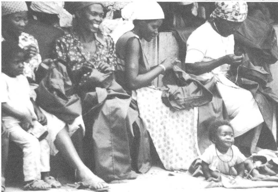
Oben: Im Informationszentrum der Unita werden die Meldungen der grossen Agenturen verarbeitet, einschliesslich Tass. Mitte: Schulunterricht für die Kleinen im Freien. Unten: Frauen nähen Uniformen für die Unita-Truppen.

und DDR-Militärs, 2500 Nordkoreaner, 3500 portugiesische Söldner, 7000 auf Seiten der Fapla kämpfende Guerillas der Südwestafrikanischen Volksorganisation (Swapo) und 1200 Leute des African National Congress (ANC) ... und bezahlt die sowjetischen Parteien bar (für 1987 hatte der sowjetische Parteichef Michail Gorbatschow militärischen Beistand in Höhe von zwei Milliarden Dollar zugesichert).