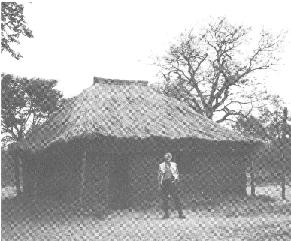
Der Verfasser vor seiner Unterkunft in Jamba.

Luanda besoldet damit, was es selbst nicht abstreitet, 47 000 Kubaner, je 5000 sowjetische