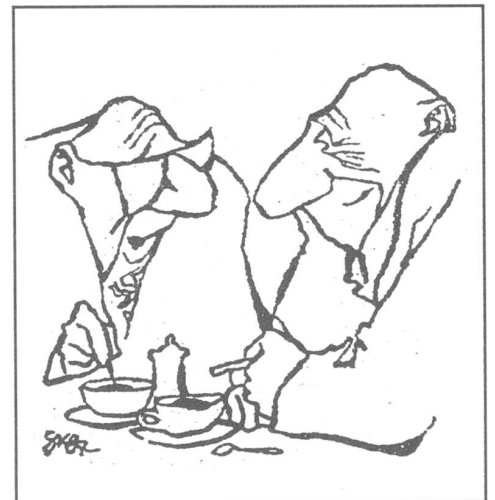
«Wie man hört, hast du dir ein Verjüngungsmittel kommen lassen, ja?» («Polityka», Warschau, 21. 11. 1987)

Mit Angriffen auf die häufigen Änderungen hervorgetreten sind einige gesellschaftliche Organisationen, darunter eine, die vor kurzem entstanden ist und sich trotz schöner Losungen konservativ verhält (gemeint ist die national-