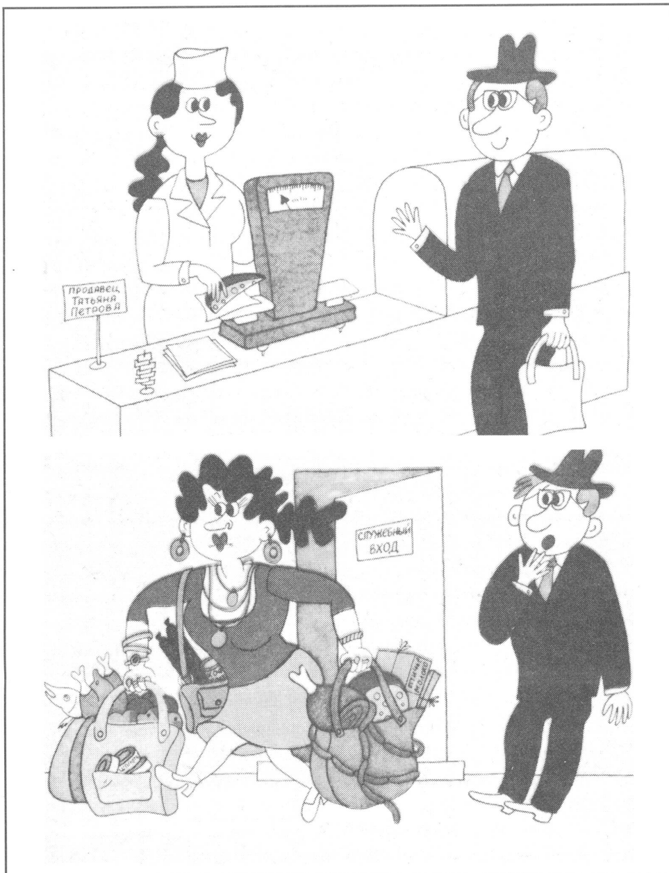
Aus der satirischen Zeitschrift «Krokodil» (Moskau, Nr. 27/1987) eine Karikatur, die dort jeder ohne Legende versteht. Eine Verkäuferin, die im Laden dem Kunden nur Winziges anzubieten hat, verlässt nach Feierabend die Arbeit mit Taschen voll von Waren, die sie sich aus den Beständen abgezweigt hat.

EW, 14. 10. 87: Sie leerten Briefe und Pakete. In den Zügen von Warschau nach Krakau und Kattowitz haben sich die Postbegleiter aus Briefen westliche Valuten und aus Paketen Luxuslebensmittel und Elektronikartikel angeeignet. Die Postverwaltung Kattowitz präzisiert, dass nicht die Hälfte aller Postangestellten unehrlich ist, sondern nur die Hälfte der Zugbegleiter, d. h. 26 von 50.