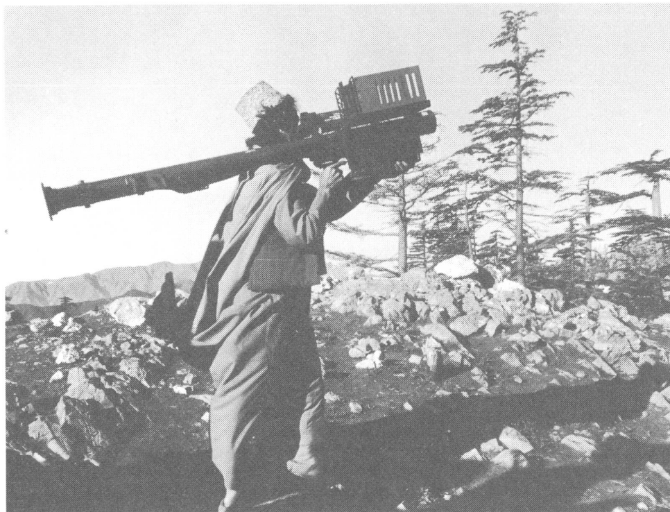
Hält die sowjetischen Kampfflugzeuge von Tiefflugangriffen ab: die amerikanische Einmannrakete vom Typ Stinger.

gerettet! Nachdem wir tagsüber – ans Schlafen dachte niemand mehr! – in der kleinen Klinik einige Behandlungen und kleinere Operationen durchgeführt hatten, konnte unsere nächtliche Reise weitergehen, an einen stilleren Ort, wo wir auch wieder einmal schlafen konnten.