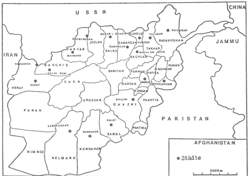
Afghanistan und seine Provinzen.

Die Fahrzeuge standen abseits, gut getarnt, im kleinen Tal unter uns: Die Medikamente waren