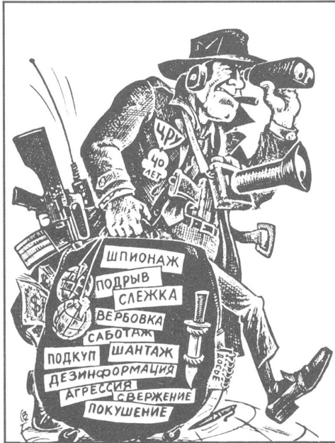
... beschwört den Subversionskrieg der CIA. («Krassnaja Swjesda», Moskau, 22. 9. 1978)

gen zu führen. Die Menschen in der Sowjetunion sind misstrauisch; ihr Verhalten wird sich nicht auf Kommando, sondern nur durch den Glauben an wirkliche und dauerhafte Reformen verändern.