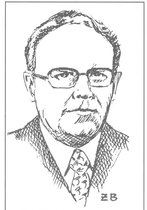
KGB-Chef Viktor Tschebrikow ...

Also muss Gorbatschow vorwärts, denn die Wirtschaftskrise zieht immer weitere Kreise. Auch in der Landwirtschaft droht ein schlechteres Resultat als im Vorjahr. Die Reformen brauchen Zeit, um zu zählbaren Verbesserungen