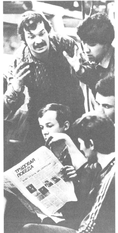
Eine Auswirkung der Glasnost ist der Run auf die Zeitungen. In diesem Jahr konnte allein schon die zentrale Presse ihre Auflage um 14 Millionen Exemplare steigern.

Nur der langsame, jetzt vielen Anzeichen zufolge und aus welchen Motiven auch immer eingeschlagene Weg erlaubt ein organisches und damit einigermaßen zuverlässiges Wachstum der Rechtsstaatlichkeit, des politischen Pluralismus und der Marktwirtschaft, dies die wichtigsten Elemente der Demokratie. Dass die