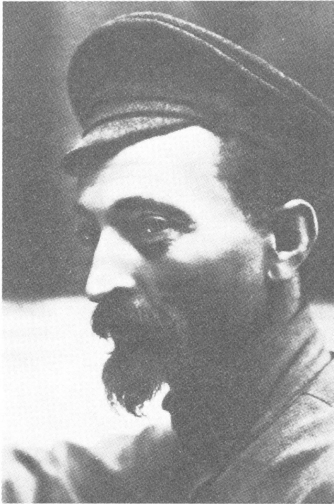
Felix Dscherschinski, der erste SD-Chef.

Regierungsbildung überspielten revolutionären Kräfte drängten darauf. So musste er sein Wort halten. Die Bolschewiken verhängten Wahlrechtsbeschränkungen über ihre erkannten Feinde und hatten praktisch das Monopol der Propaganda. Trotzdem bescherten ihnen die Wähler eine vernichtende Abfuhr. Die Bolschewiken erhielten nur gerade ein Viertel der abgegebenen Stimmen.