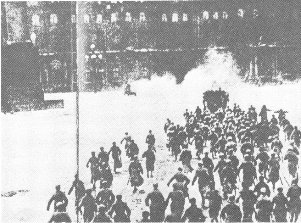
Die (einzige) Aufnahme vom Sturm auf das Winterpalais in Petrograd.

tum vom 12. Mai wird in der UdSSR als «Tag der Presse» begangen.)