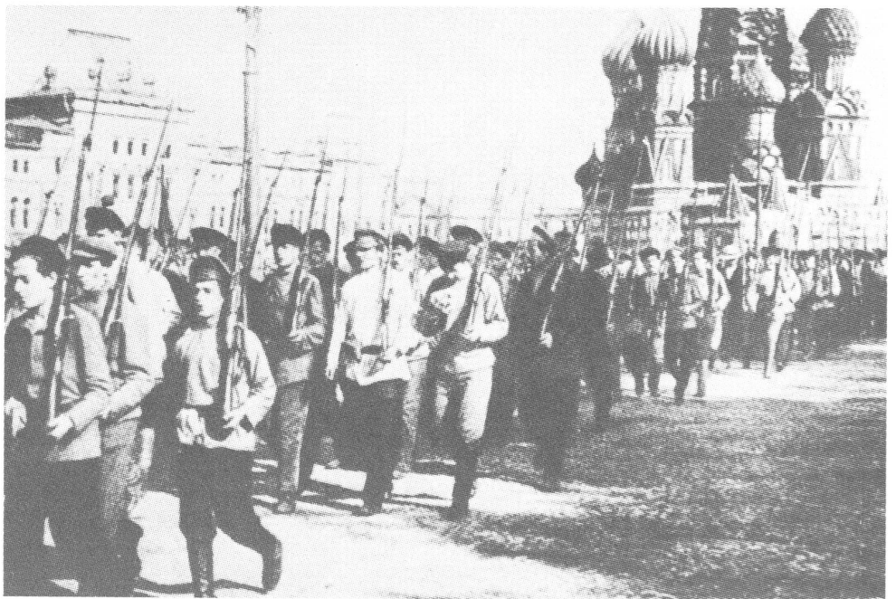
Truppenparade auf dem Roten Platz 1918.

Der eigentliche Bürgerkrieg brach 1918 aus. Der Grund dafür war der, dass mehrere Völker die sie betreffende bolschewistische Deklaration zum Sezessionsrecht wörtlich nahmen und eigene Nationalstaaten ausriefen: Ukraine, Weissrussland, baltische Staaten, Transkaukasus-Staaten, Polen und Finnland. An diese Konsequenz hatte Lenin nicht gedacht und ging nunmehr daran, die territoriale Integrität des zaristischen Russlands wiederherzustellen.