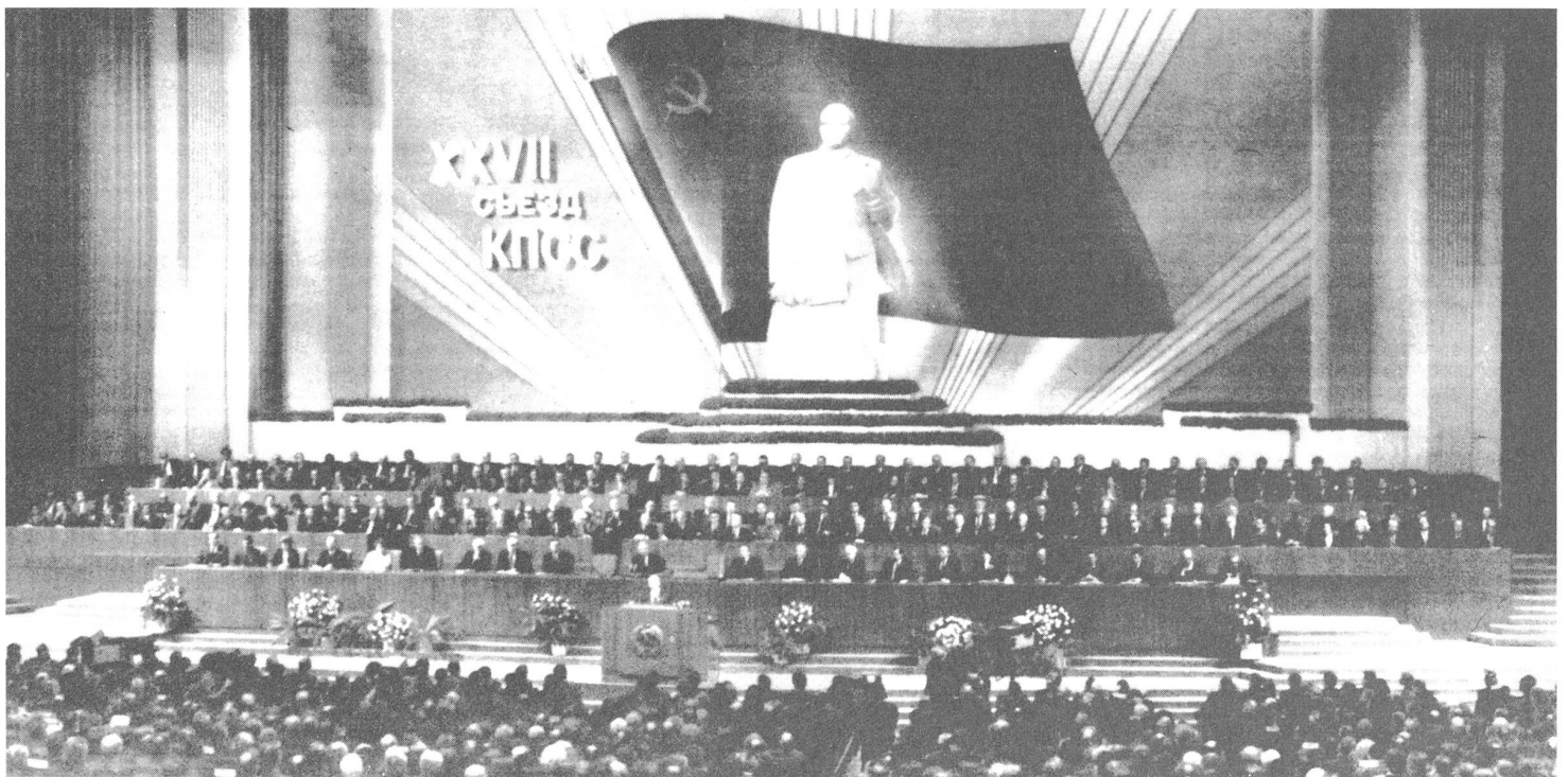
Der 27. Parteikongress.

Am 16. Mai 1985 verabschiedete dann das Präsidium des Obersten Sowjets den wichtigen Ukas «Über Massnahmen zur Verschärfung des Kampfes gegen Trunksucht und Alkoholismus, zur Liquidierung der Schwarzbrennerei». Der Ukas bestimmt hohe Geldstrafen wegen Spirituosenkonsums auf Strassen, öffentlichen Plätzen, in Parks, ferner wegen Erscheinens in angetrunkenem Zustand auf öffentlichen Plätzen. Bürger, die auf der Strasse in stark angetrunkenem Zustand gefunden werden, müssen in die Ernüchterungskammer der Polizei eingeliefert werden. Gleichzeitig wurde auch das Reglement für die schon überall – in territorialen Verwaltungseinheiten, Betrieben – tätigen Antialkohol-Kommissionen verabschiedet. Alkoholverkauf wurde vor 14 Uhr und in der Nähe der Betriebe überhaupt verboten, zahlreiche Alkoholgeschäfte und Wirtshäuser wurden geschlossen. Die Folge war, dass der Alkoholkonsum statistisch zurückging; dagegen verbreitete sich die Schwarzbrennerei.