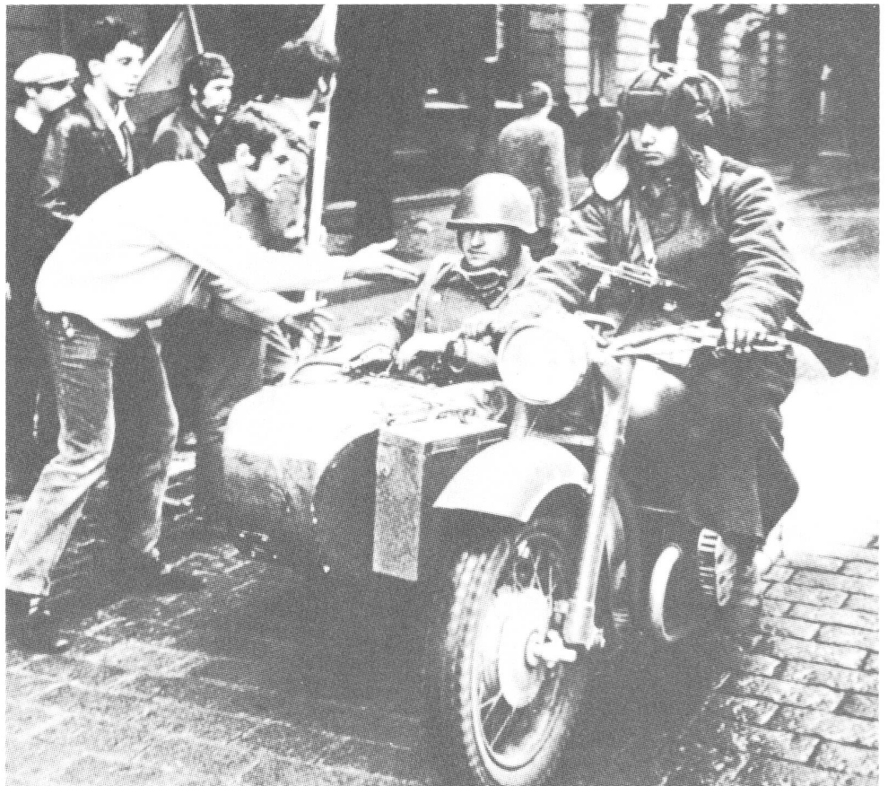
Die Anwendung der «Breschnew-Doktrin» beim Einmarsch in die Tschechoslowakei: Strassenszene in Prag am 21. August 1968. Jugendliche bestürmen die einfahrenden Sowjets.

In der zweiten Hälfte der siebziger Jahre spitzte sich die politische und wirtschaftliche Lage auch in Polen immer mehr zu und führte nach der Streikbewegung im August 1980 im Küstengebiet zur «gesellschaftlichen Vereinbarung» zwischen der Regierungskommission und den interbetrieblichen Streikkomitees des Küstengebietes. Die polnische Entwicklung ging nachher in Richtung eines gewerkschaftlichen und politischen Pluralismus. Die Geschichte wird abklären, ob der am 13. Dezember 1981 verkündete Kriegszustand nicht eine Alternative zur sowjetischen Besetzung war. Breschnews Aktivität liess 1981 schon nach, und so war er mit Jaruzelskis Verrat zufrieden gestellt.