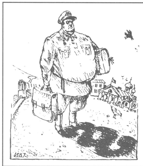
Ohne Worte aus «Moscow News», Moskau, Nr. 38/1987.

Das Gesetz über die individuelle Erwerbstätigkeit ist die Konkretisierung des Art. 17 der Verfassung; in dieser Beziehung blieb aber die UdSSR weit hinter einigen Bruderstaaten (besonders der DDR, Polen und Ungarn) zurück, wo diese Arbeit schon viel früher zugelassen wurde. Das sowjetische Gesetz geht in der Liberalisierung nicht so weit: Die individuelle Erwerbstätigkeit wird für Erwachsene nur als Nebenbeschäftigung in der Freizeit erlaubt, sowie für deren Familienmitglieder, ferner wird sie für Studenten, Gymnasiasten und Rentner zugelassen, aber ohne Beschäftigung fremder Arbeitskräfte (Art. 1), um Ausbeutung zu verhindern. (In den erwähnten Volksdemokratien