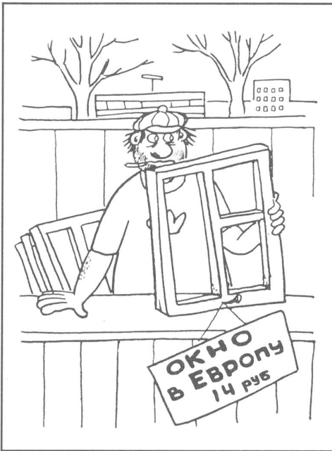
«Das Fenster zu Europa — 14 Rubel.» («Krokodil», Moskau, Nr. 25/1987).

In der Aussenpolitik wollte er anfänglich vor allem die Führungsposition der UdSSR im sozialistischen Lager festigen. Am 21. Juni 1985 charakterisierte die «Prawda» die innenpolitische Entwicklung in «einigen Bruderstaaten» wie folgt: «Es gibt Beispiele für zionistische und nationalistische Erscheinungen ... Es gibt solche (Politiker), die der Meinung sind, die von den Klassikern des Marxismus-Leninismus sowie in den Dokumenten der brüderlichen Parteien verankerten allgemeinen Gesetzmäßigkeiten seien nur für die Vergangenheit richtig gewesen; sie stellen deren objektiven und universalen Charakter in Frage ... Der Klassenfeind baut weiterhin auf den Nationalismus, westliche Propagandamittel spekulieren mit jenen Problemen, welche die sozialistischen Länder von der Vergangenheit geerbt haben ... Der Nationalismus, der offen oder verschleiert zum Russenhass und Antisowjetismus führt, untergräbt die Zusammengeschlossenheit der sozialistischen Nationen.»