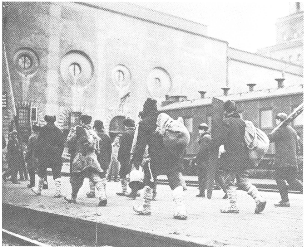
Arbeitskräfte vom Land kommen 1926 nach Moskau.

Die Kulaken wurden nicht nur als Klasse, sondern auch als Menschen liquidiert. Die eingeschüchterten Mittel- und Kleinbauern galten in diesem «Kampf» als Verbündete, aber danach erklärte man sie, wenn sie nicht rasch genug den Genossenschaften beitraten, selber zu