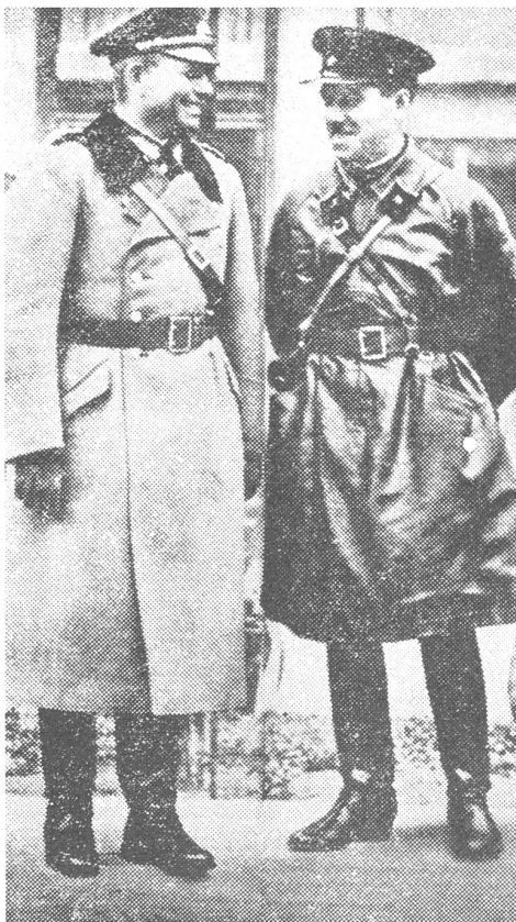
Polenfeldzug 1939. In Brest-Litowsk schloss sich die deutsch-sowjetische Zange. Der reichsdeutsche Panzergeneral Guderian und der sowjetische General Kriwoschin (rechts) nahmen gemeinsam eine Parade ab.

Am 17. September überfiel die Sowjetunion gemäss ihrer Vereinbarung mit Hitler ihrerseits Polen trotz eines «ewigen Friedensvertrags» (Riga, März 1921) und eines Nichtangriffspakts (1932) mit diesem Land. In den letzten Tagen des gemeinsam gegen Polen geführten