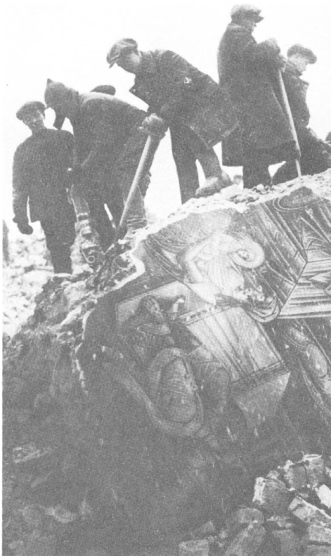
Abbau eines Klosters 1927.

1932 führte man das sogenannte «Passsystem» ein. Niemand durfte ohne «Pass» (Personal-