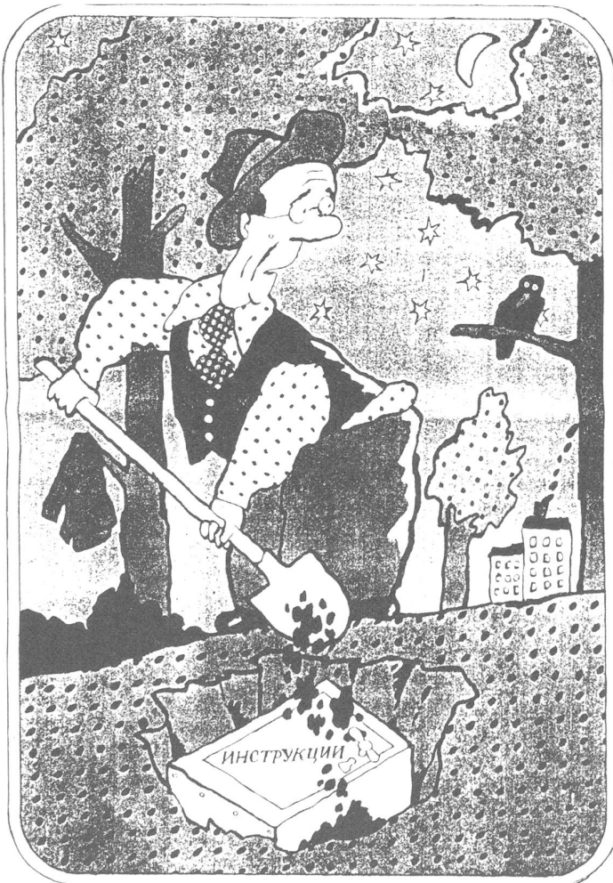
Begraben werden «Instruktionen». Aber gut verpackt und gegebenenfalls wieder auszugraben. («Krokodil», Moskau, Nr. 26/1987).

Bemerkenswert ist nämlich der Umstand, dass von all den zahlreichen halboffenen Gesellschaften nur jene im Kreuzfeuer westlicher Kritik stehen, die sich entweder ausdrücklich zum Westen bekennen und/oder ein bedeutendes strategisches Interesse erwecken. Zur Illustration: Von den gelegentlichen Hinrichtungen zur Zeit des Schahs von Persien wurde viel Aufhebens gemacht; die tausendmal mehr Hinrichtungen unter Khomeiny werden allzu gerne verdrängt. Oder: Der Bürgerkrieg auf Sri Lanka im Jahre 1971 hatte schlimmere Auswirkungen als die heutigen Kämpfe für die Unabhängigkeit der Tamilen; damals, als die Sowjetunion nicht, wie heute, hoffen durfte, dank vertraglicher Abmachungen mit Indien einen Zugriff auf den besonders wichtigen Hafen von Trincomalee zu erwirken, blieb das Interesse an der Konfliktschürung begrenzt und setzte keine Fluchtbewegung mit ausländischer Hilfe nach Westeuropa ein. ■