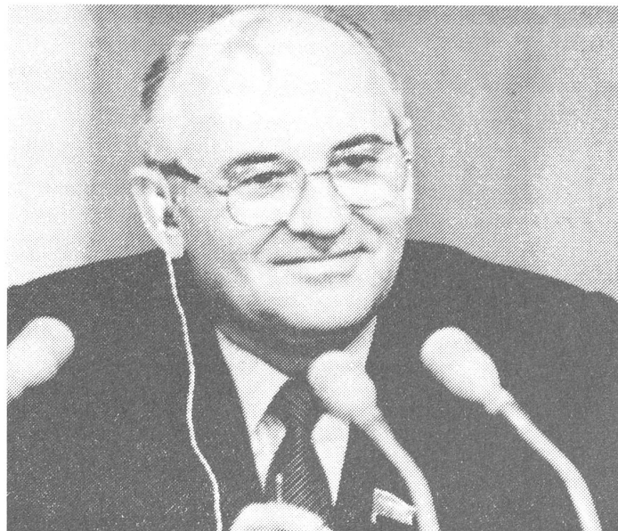
Gorbatschow: Mit dem System gegen das System?

Das hat er 1917 bewerkstelligt, allerdings nicht in erster Linie dank der Vorzüge seiner Partei, sondern dank der Rückschläge und Erschwernisse, die Russland im Ersten Weltkrieg erfuhr. «Mir schwindelt», sagte Lenin am ersten Parteikongress nach der Machtübernahme in deutscher Sprache, vom Erfolg überwältigt. Mit diesem Sieg sollte Russland «ins Glied» zurücktreten und die Führung dem Sozialismus überlassen, der in den fortgeschrittensten kapitalistischen Ländern siegen musste. Ansätze dazu