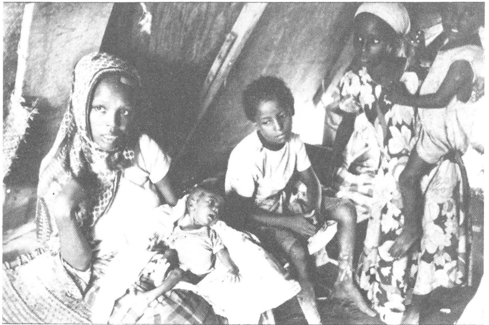
Äthiopische Flüchtlinge in Djibouti.