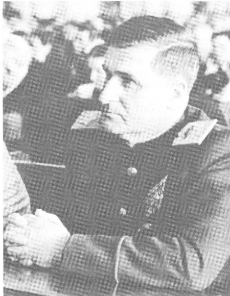
Marschall Wassili Sokolowski, seinerzeit Generalstabschef und Autor der frühen «Militärstrategie».

«Besonders aktuell ist heute die Verbindung der Innenpolitik mit der Aussenpolitik... Die