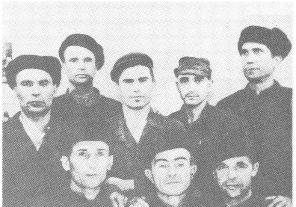
Gruppe von Krimtataren in einem sowjetischen Lager. Interniert wurden sie deshalb, weil sie ihr Recht auf Rückkehr in ihre Heimat auch zuhanden der ausländischen Öffentlichkeit proklamiert hatten.

Diese und andere Massnahmen waren von einem individuellen und kollektiven Terror begleitet, der mancherorts in eine Liquidationskampagne ausartete. Die materielle Kultur der Tataren wurde zerstört; man entzog ihnen einen Grossteil ihrer Ländereien und Wälder;