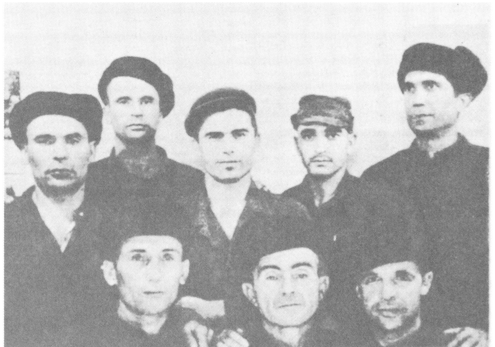
Gruppe von Krimtataren in einem sowjetischen Lager. Interniert wurden sie deshalb, weil sie ihr Recht auf Rückkehr in ihre Heimat auch zuhanden der ausländischen Öffentlichkeit proklamiert hatten.

Diese und andere Massnahmen waren von einem individuellen und kollektiven Terror begleitet, der mancherorts in eine Liquidationskampagne ausartete. Die materielle Kultur der Tataren wurde zerstört; man entzog ihnen einen Grossteil ihrer Ländereien und Wälder;