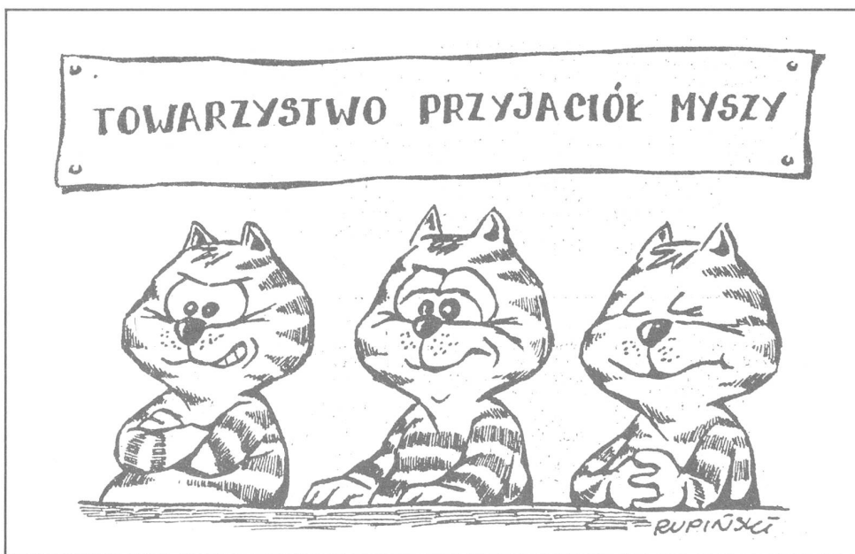
«Gesellschaft für Mäusefreunde.» («Polityka», Warschau, Nr. 29/1987.) Wie Gesellschaft für Friedensfreunde.