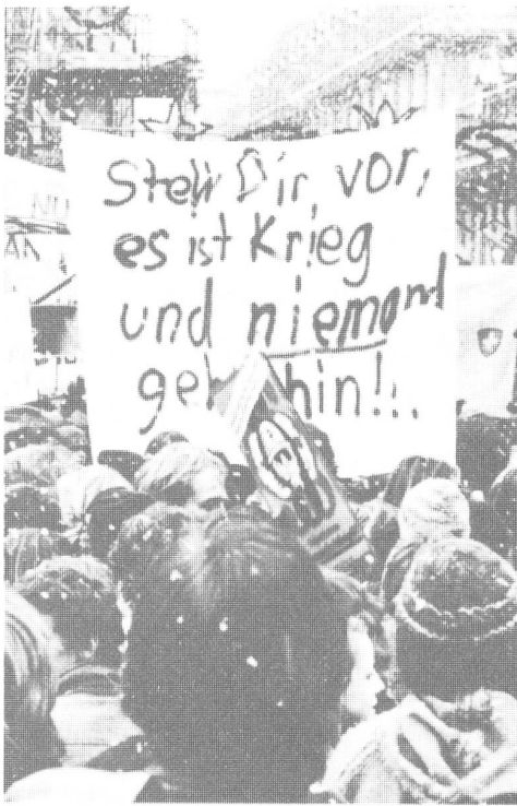
Auch ein Signal. Wer den Verzicht auf Verteidigung fordert, dient nicht dem Frieden, sondern möglichen Aggressoren. Bild und Bildlegende aus dem Buch.

dies zum Abschluss seines Buches an, wenn er darlegt, dass die Glaubwürdigkeit der Dissuasion dann erhöht wird, wenn die Beweise für einen intakten Selbstbehauptungswillen der Bevölkerung sichtbar werden.