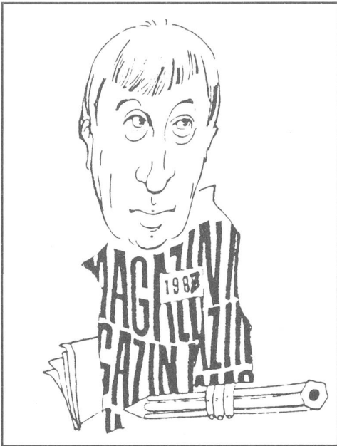
Karikiertes Humorst.

ein Mord, vorzugsweise in mehrfacher Ausführung oder dann von einmaliger Brutalität.