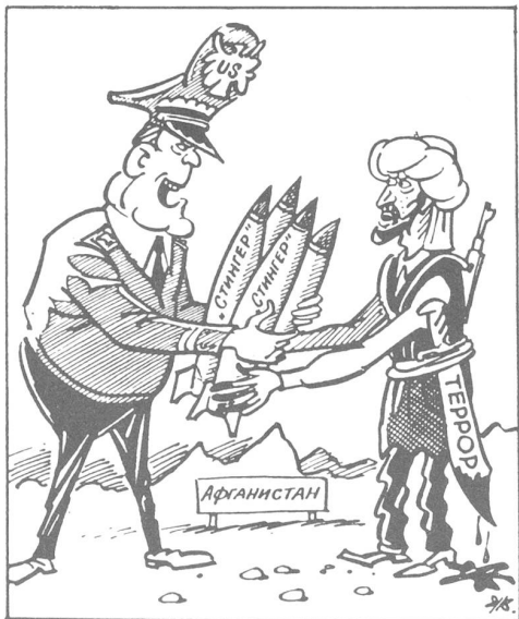
Die USA liefern dem afghanischen Terror ihre Stingers. («Krasnaja swjesda», Moskau, 13. 5. 1987)