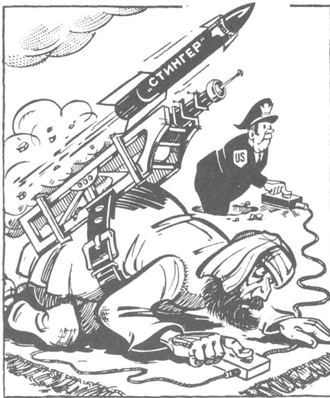
«Banditengebet». Stinger-Abschuss von der Startrampe eines Partisanen. («Prawda», Moskau, 26. 4. 1987)