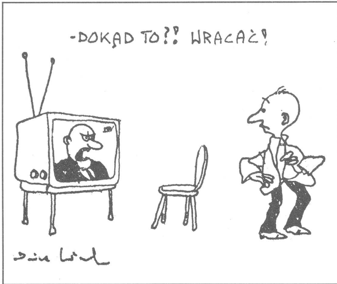
«Wohin denn? Zurück!» (Prawo i Zycie», Warschau, Nr. 26/1987)

Zur Kriegführung beispielsweise sind auch Staaten befähigt, welche es mit der Glasnost unendlich weiter gebracht haben als die Sowjetunion, nämlich bis zur Freiheit für die oppositionelle Presse und für die oppositionellen Parteien. Es ergibt sich, dass ein Echtheitsbefund für die Perestrojka keinen Echtheitsbefund für die Friedfertigkeit darstellt, und dass umgekehrt kein Friedensbeweis (wie Rückzug aus Afghanistan) vonnöten ist, um die Perestrojka als authentisch einzusehen.