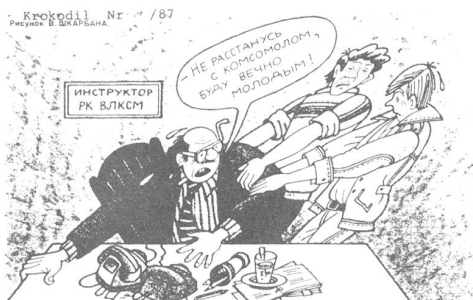
Komsomol-(Jugendorganisation)-Instruktor: «Ich verlasse den Komsomol nie und bleibe immer jung.» («Krokodil», Moskau, Nr. 17/1987)