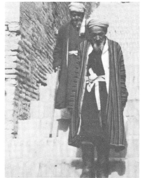
Alte Leutchen, halt ein bisschen rückständig. Das Bild, das man sich bis anhin von den Moslems in Zentralasien machte. Pilger auf der heiligen Treppe von Samarkand. (Foto: cb)

Anscheinend stellen die lokalen Parteiorganisationen kein Bollwerk dar, mindestens kein geschlossenes: «Überraschend ist es, wie gleichgültig sich einige Parteikomitees gegenüber der Islambegeisterung verhalten. Zum Beispiel hat man (behördlicherseits) im Gebiet Dschisak für die Renovation einer Moschee 500 000 Rubel ausgegeben. Das Gebietskomitee der KPdSU wusste das und reagierte nicht.» Offenbar handelt es sich hierbei nicht um ein Gebäude von kulturhistorischem Wert, da die Pflege von denkmalschutzwürdigen Objekten zu den deklarierten Anliegen der Partei gehört. Das Ärgernis besteht ersichtlicherweise darin, dass es mit dem Segen der betreffenden Parteiorganisation zu einer Subventionierung der Glaubensverbreitung gekommen ist.