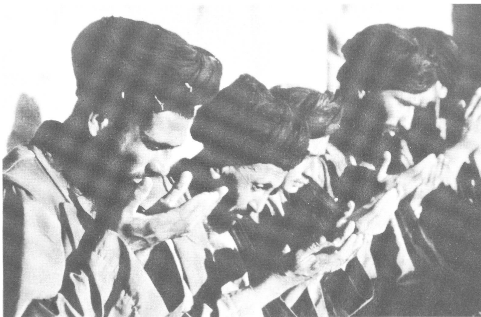
Betende Mujahedin in Afghanistan. Den Dschihad in die UdSSR verlegen.