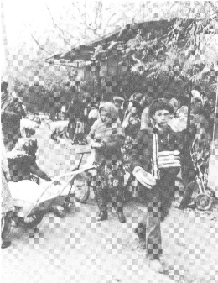
Marktszene in Usbekistan.

handelt habe. Eine Verwechslung dieser beiden Kategorien (auf deren Zugehörigkeit in Kriegszeiten so oder anders als Höchststrafe der Tod steht) liegt im Lande Lenins jederzeit drin; da braucht weder dem sowjetischen Autor noch dem sowjetischen Leser etwas aufzufallen. Auffallen sollte so etwas allerdings hier in diesem Lande, wo man eine Initiative zur Abschaffung der Armee ausgerechnet an einer Leningedenkstätte lancieren wollte, in Ehrung des Mannes, dessen Ordnung den grössten Militarismus der bisherigen Menschheitsgeschichte hervorgebracht hat. Wieso man dazu kommt, solchen Leuten ihren angeblichen Antimilitarismus abzukaufen, ist ein Rätsel, aber ein rein schweizerisches.