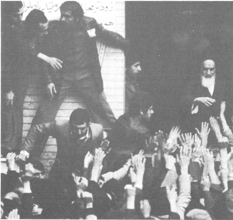
Fanatische Fundamentalisten in Iran. Wo findet die Dritte Islamische Revolution statt?

«Die Religiosität breiter Gesellschaftsschichten verhält sich meist direkt proportional zur Zahl ihrer ungelösten sozialen Probleme.»