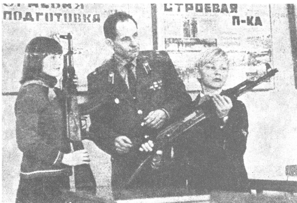
Militärvaterländischer Unterricht in der Stucka-Mittelschule der lettischen Hauptstadt Riga

Für die Sowjetführung ist das (selbstredend) eine falsche Frage. Sie huldigt dem wie immer formulierten Grundsatz, dass sich ein mitdenkender Wehrmann um so wehrfreudiger einsetzen werde, und tatsächlich ist die Armee besser als andere Institutionen in der Lage, der Eventualität vorzubeugen, dass sich vermehrtes Denken auch noch in andern Formen kundtut als nur im Mitdenken.