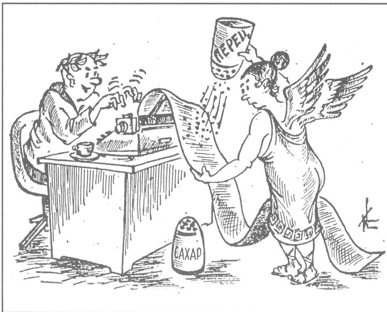
Oben: Perestrojka. Der Zucker ist weggestellt und der Pfeffer kommt in Aktion. Rechts: Gesammelte Werke, nämlich «Vorwort», «Leerwort» und «Nachwort». («Literaturnaja gaseta», Moskau, 15. 4. 1987)

Im Gegenteil: Der zweitmächtigste Mann der Staats- und Parteihierarchie, Politbüromitglied und ZK-Sekretär Ligatschow, meldete Anfang März sogar offen Bedenken gegen die von Gorbatschow forcierten Kritiken in den Medien