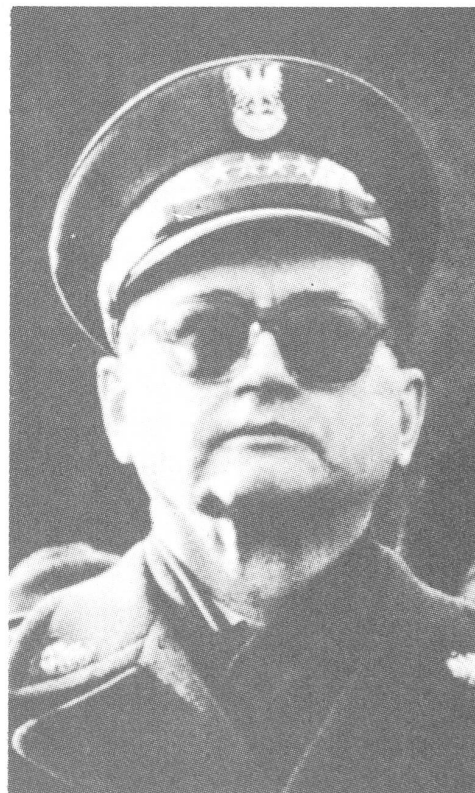
Jaruzelski: Putsch aus dem Dunkeln.

Das ZeitBild wird in der nächsten Nummer ausführlich auf diese Enthüllungen des polnischen Überläufers eingehen.