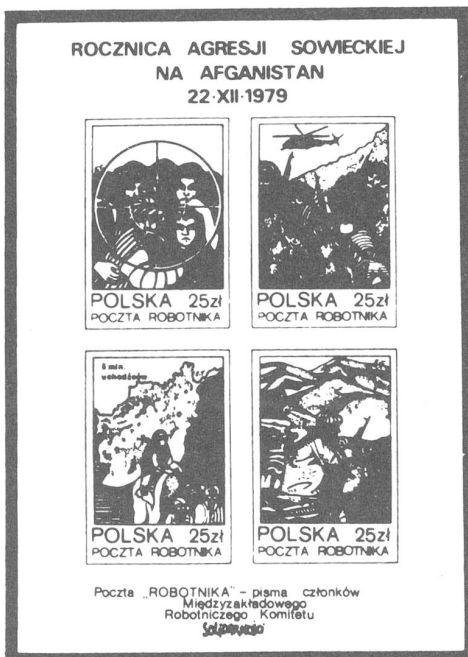
Diese Untergrund-Briefmarken der verbotenen Gewerkschaft Solidarnosc sind dem Widerstandskampf des afghanischen Volkes gewidmet.

Ich bin erwerbstätig/nicht erwerbstätig (Zutreffendes unterstreichen).