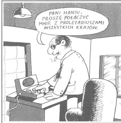
«Fräulein, verbinden Sie mich bitte mit den Proletariern aller Länder.» («Szpilki», Warschau, 19. 3. 1987.)

Eine Umfrage unter Studenten der Rechtsfakultät an der Universität Tiflis hat zu einem Ergebnis geführt, das der Verfasser des «Prawda»-Beitrags angesichts der bestehenden Verhältnisse «nicht erstaunlich» findet. Zwei Drittel der Befragten sind der Meinung, dass die Teilnahme des Rechtsanwaltes am Gerichtsverfahren eine bloße Formalität sei, da er praktisch auf die Entscheidung in der Angelegenheit keinen Einfluss ausübe. Die schon bei der Ausbildung geförderte Missachtung der einen Prozesspartei führt dann schliesslich in der Praxis dazu, dass es zu «harten Urteilen gegenüber Unschuldigen» kommt, der Neigung des Gerichtes entsprechend, die Schuld des Ange-