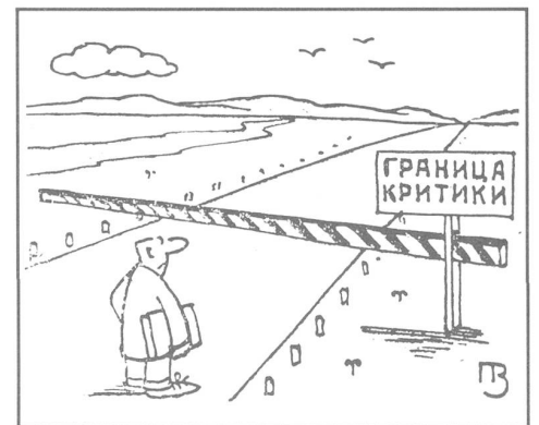
«Grenze der Kritik.» («Literaturnaja gazeta», Moskau, 18. 3. 1987.)