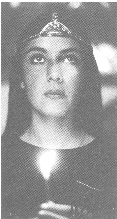
«Euer gedenkend.» Titelfoto von «Ogonjok», Moskau, 21. 3. 1987: Betendes Mädchen mit Kerzenlicht.