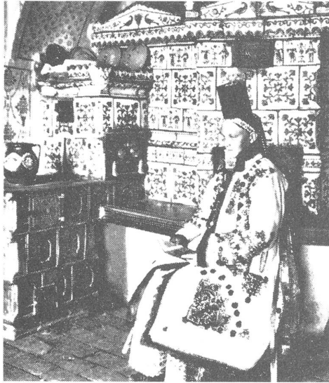
Siebenbürgen: sächsische Kirchentracht aus Jaad bei Bistritz

Die ungarische Öffentlichkeit begann gleichzeitig, an der Budapester Regierung zu kritisieren,