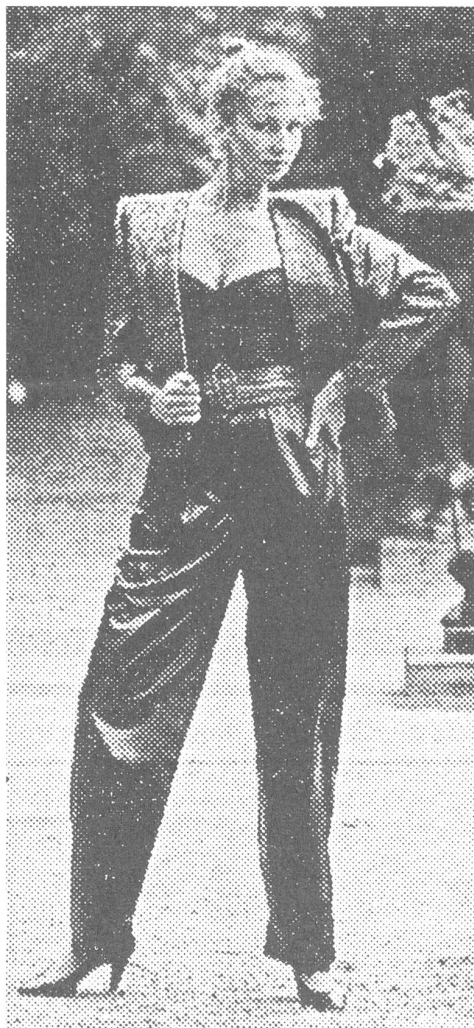
Mit Schnittbogen zum Selbstschneidern und Vierfarbenfotos der aktuellen Bekleidungs-trends wird eine russische Ausgabe der Zeitschrift «burda-moden» den Sowjetfrauen einen «modischen Schritt voraus» ermöglichen. Zum Start der allerersten westlichen Zeitschrift in der UdSSR erklärte Burda-Verlagsleiter Made in Moskau: «(burda-moden) sind ein Glücksfall, da ist kein Wörtchen Politik drin.» Hier irrt der Manager aus Offenburg (BRD), denn mit Mode lässt sich sehr wohl Politik machen (abgesehen davon, dass Kleider Leute machen...).