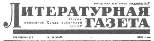
Sowjetzeitungen aus Moskau (von links nach rechts: «Krasnaja Swjesda», «Trud», «Literaturnaja Gasjefa»).

gen Programms zur Entwicklung der ökonomischen und wissenschaftlich-technischen Zusammenarbeit zwischen Rumänien und der Sowjetunion und zur Spezialisierung der Produktion. Wir haben auch die Kriterien betreffend die Bildung gemischter Gesellschaften mit der UdSSR und anderen sozialistischen Staaten