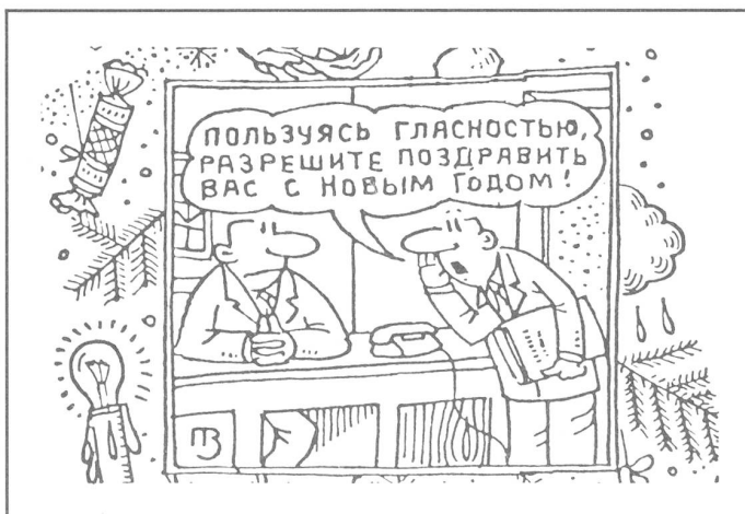
Das Stichwort des Jahres in der Neujahrsausgabe von «Trud», Moskau: «Gestatten Sie mir, die Politik der Offenheit (glasnost) zu verwirklichen, indem ich Ihnen ein gutes neues Jahr wünsche.»